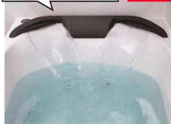
ツインの水流で体を包み込み全身をしっかりあたためる