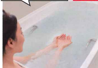
泡のベールにつつまれる贅沢なひととき