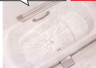
スイッチひとつでらくらく自動洗浄