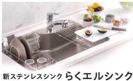
新ステンレスシンクらくエルシンク